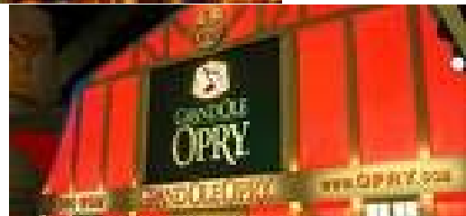
Grand Ole Opry